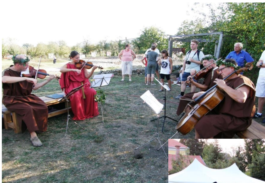
Gudači kvartet Sebastijan 2011.g.