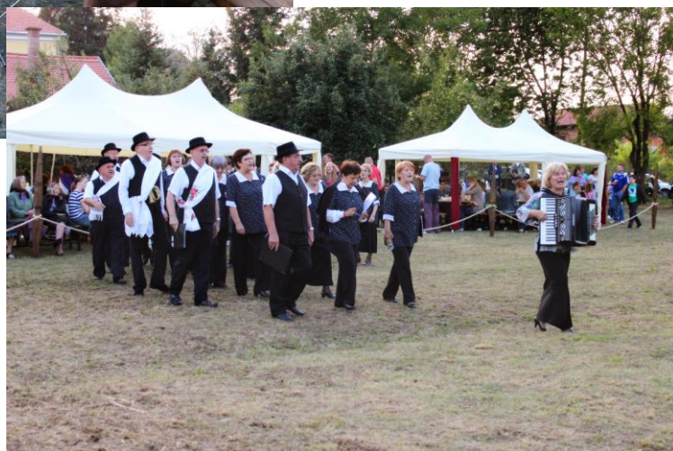
Turopoljska zvona 2012.g.