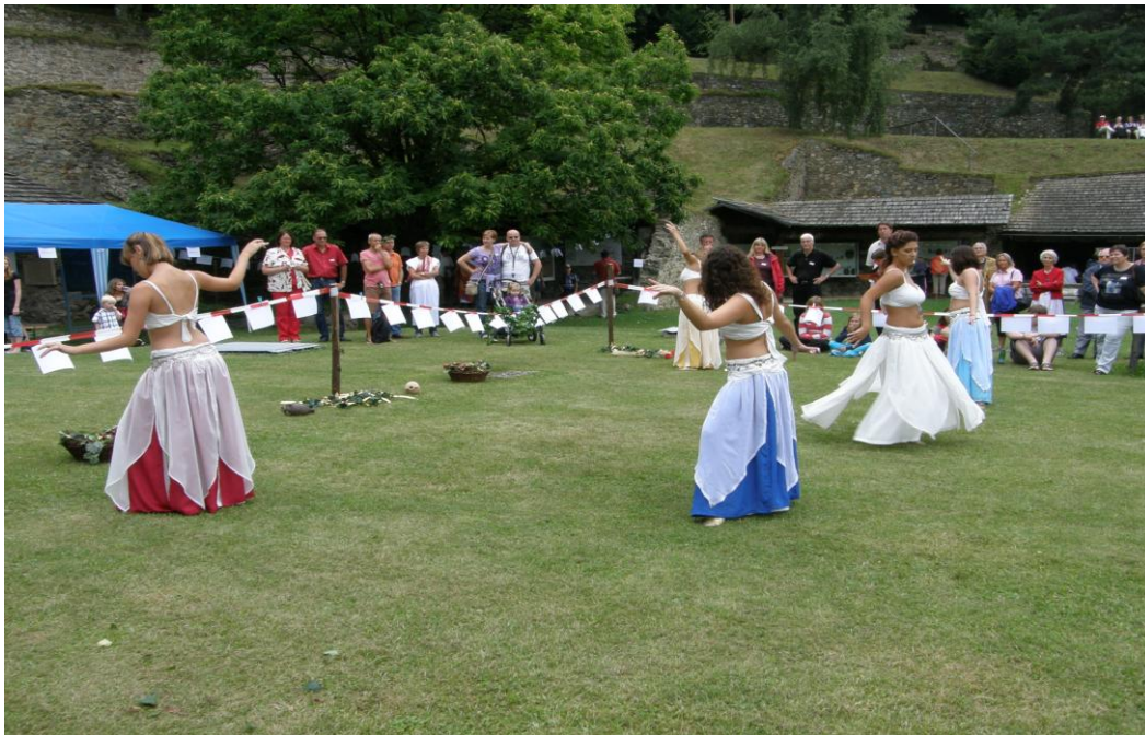
Rekreacijska grupa trbušnog plesa Zagreb